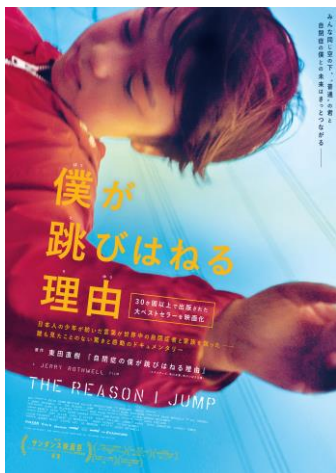
©2020 The Reason I Jump Limited, Vulcan Productions, Inc., The British Film Institute