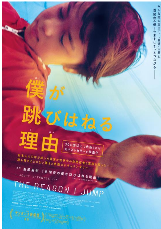
©2020 The Reason I Jump Limited, Vulcan Productions Inc., The British Film Institute